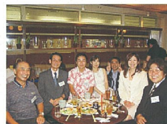
高岡郷人会の様子

故郷を離れて、東京で頑張っている皆さんも是非、県人会や地元市町村人会などに参加されて、ふるさとを思いだしてみませんか？