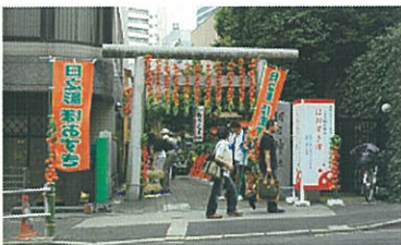
ほおずき市の様子(朝日神社:六本木)

7月12、13日の2日間、港区六本木の朝日神社において、日之影町主催の「ほおずき市」が開催されました。ほおずきの展示販売、お茶や加工食品、竹かごなどの物産販売も行われ、多くの来場者でにぎわいました。