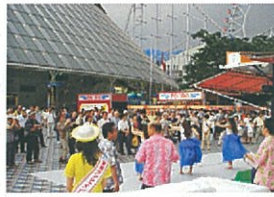
球場外でもフラダンス ショーなどで宮崎をPR

また、県出身者など120人が、オレンジ色の特製Tシャツを着て外野スタンドから声援を送りました。