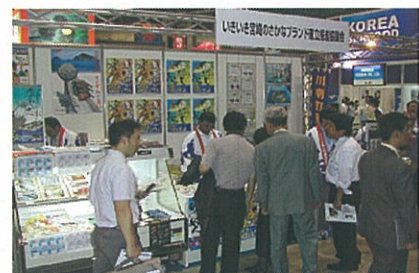
シーフードショーの様子(東京国際展示場)

宮崎からは、「いきいき宮崎のさかなブランド推進協議会」が今年で2回目の出展で、新商品や宮崎の水産加工品など豊富な商品紹介を行いました。