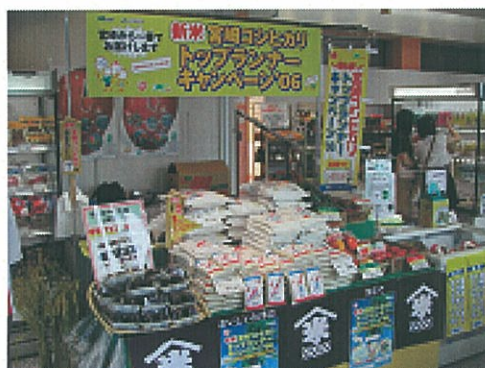
新米フェアの様子(新宿みやざき館KONNE)

7月28日~30日、新宿みやざき館「KONNE」において、日本一早い新米コシヒカリのフェアを開催しました。今年の早期水稻は、天候不良に悩まされ、収穫期など例年よりも遅くなりましたが、無事に実施することが出来ました。フェアでは、精米やおにぎりの販売、冷や汁の試食など行い、初日から大盛況のにぎわいで、準備した新米は3日間で完売しました。