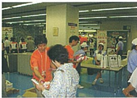
抽選券配付の様子