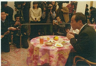
品川プリンスホテルでの取材の様子

▼就任後2度目の上京からは、首都圏で本格的な「宮崎」セールスが始まりました。 ▼この日は、AM11:00までに3本のテレビ番組の生出演を終え、その後、新橋演舞場・テレビ生出演・品川プリンスホテル・ジャスコ品川シーサイド店とまさに分刻みのスケジュールで「宮崎」のセールスを行いました。