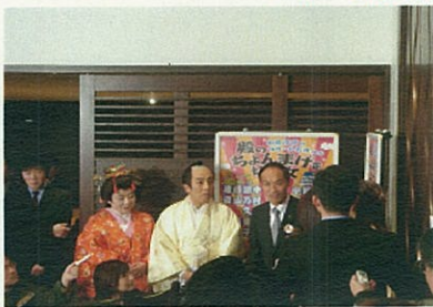
新橋演舞場での会見の様子

▼就任後2度目の上京からは、首都圏で本格的な「宮崎」セールスが始まりました。 ▼この日は、AM11:00までに3本のテレビ番組の生出演を終え、その後、新橋演舞場・テレビ生出演・品川プリンスホテル・ジャスコ品川シーサイド店とまさに分刻みのスケジュールで「宮崎」のセールスを行いました。