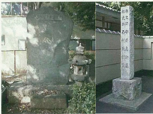
安井息軒墓（文京区千駄木：養源寺）