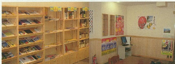
九段みやざき情報館