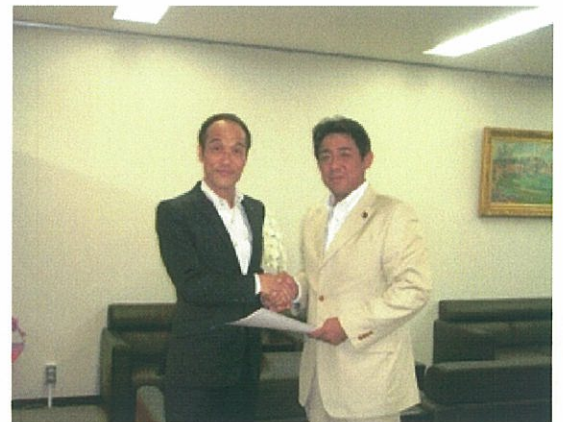
<松村経済産業大臣政務官と東国原知事>