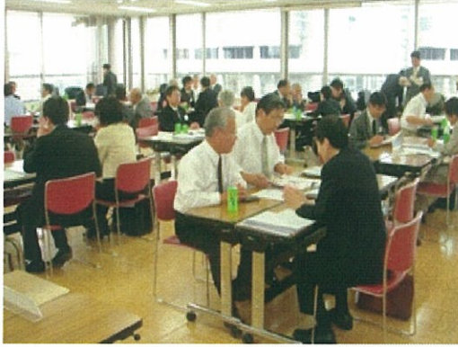
<個別説明会の様子>