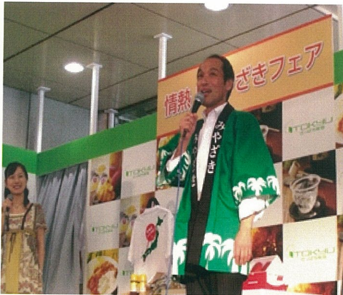
＜東国原知事のトップセールス＞