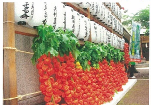
<神社を飾る日之影町のほおずき>