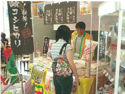
<キャンペーンの様子>