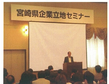
<東国原知事による講演>