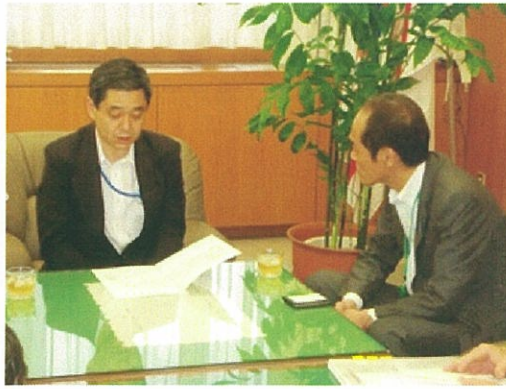
<山田水産庁長官へ要望>