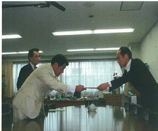
<松村経済産業大臣政務官と長谷川中小企業庁長官へ要請>