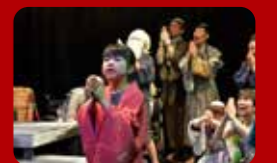
おきらく劇場ピロシマ（広島）