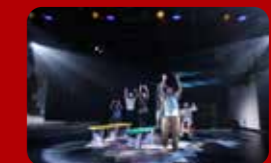
みやざき◎まあるい劇場（宮崎）