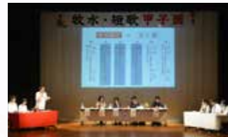
牧水・短歌甲子園（日向市）