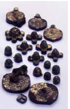
国宝「日向国西都原古墳出土金銅馬具類」（複製） ※原品は五島美術館所蔵

宮崎県ゆかりの唯一の国宝である「日向国西都原古墳出土金銅馬具類」を中心に馬をキーワードとして、九州や畿内の出土品を含む様々な資料を展示します。