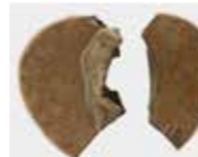
塩見城跡土製聖人像