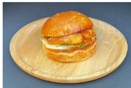
唐津Qサババーガー