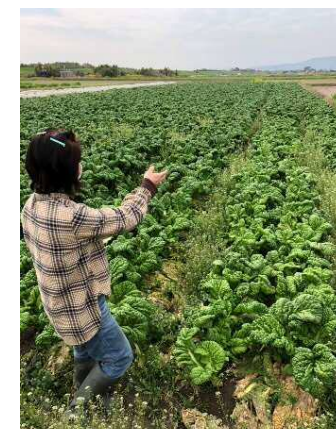
農業女子PJとの連携