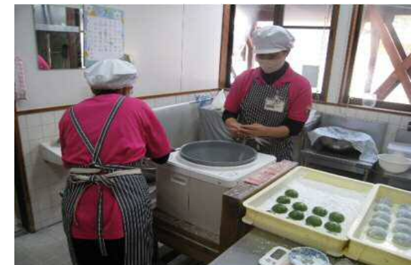
人気加工品「草だんご」作り