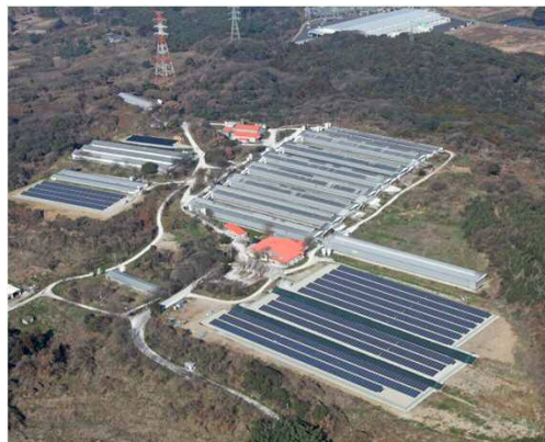
サンファーム農場全景