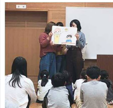
子供に食育の場を提供