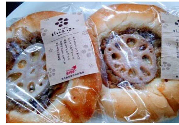
“パン DE レンコン” 地域の特産「レンコン」を活用