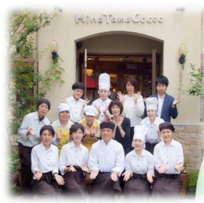
直営店舗ひなたまごっこ